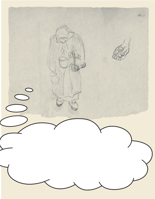
Eine Frau beugt sich über ihre Essensration, daneben eine Hand mit Kartoffeln.